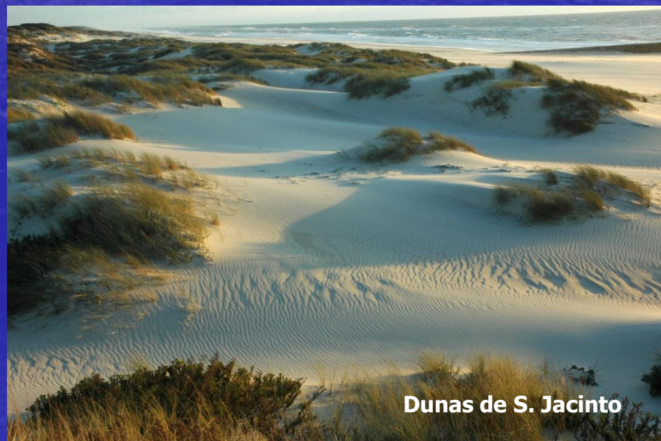
Dunas de S. Jacinto