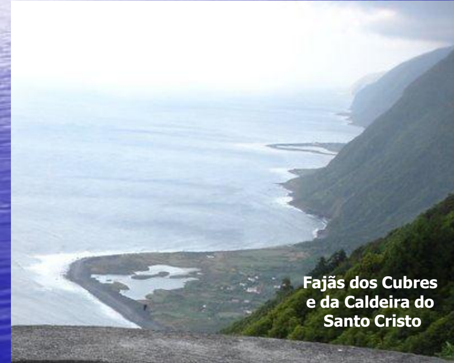
Fajãs dos Cubres e da Caldeira do Santo Cristo