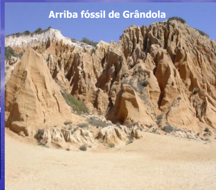
Arriba fóssil de Grândola