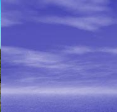
Restinga de Esposende