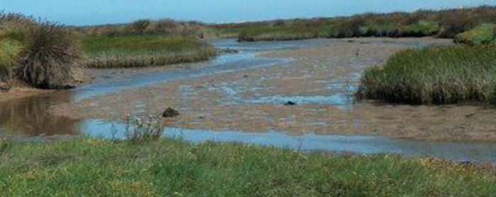
Sapal de Esposende